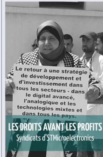
LES DROITS AVANT LES PROFITS Syndicats d'STMicroelectronics