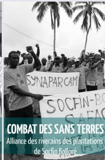
COMBAT DES SANS TERRES Alliance des riverains des plantations de Socfin Bolloré